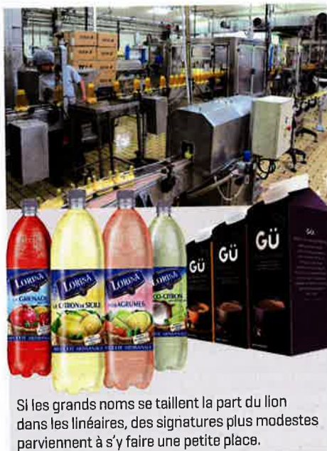
Si les grands noms se taillent la part du lion dans les linéaires, des signatures plus modestes parviennent à s'y faire une petite place.