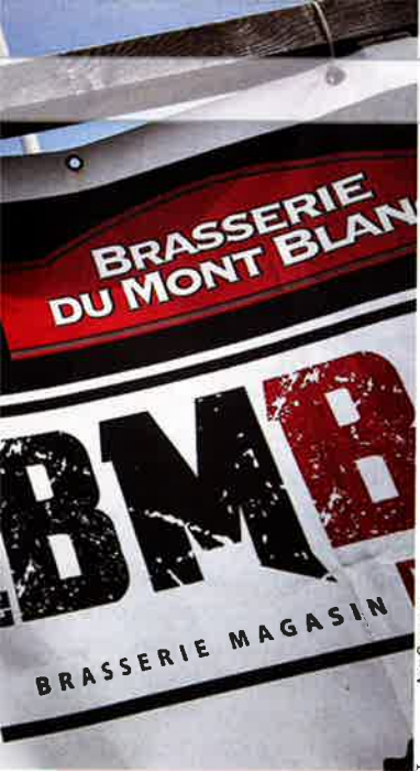
LES STUDIOS ART SYSTEM

Le phénomène des micro-brasseries [dont la Brasserie du Mont-Blanc, en photo, est une illustration] annonçait une demande nouvelle favorable à l'offre de challengers.